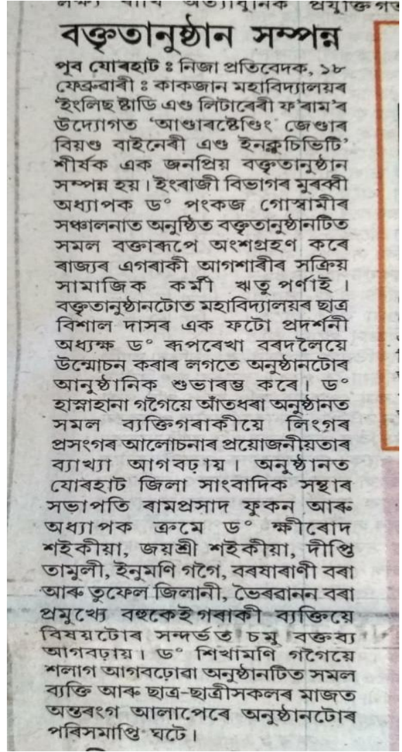
Some Photos of the event: